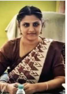
ఎమ్ పి డి ఓ వేదవతి

ఎక్కడ ఉందో తెలుసా? రాత్రింబవళ్లు ప్రజల ఆరోగ్యం కోసం పరితపించే ఆశా కార్యకర్త చెమటల్లో ఉంది.. పసిపిల్లలకు తల్లిప్రేమతో అక్షరాలు నేర్పే అంగన్వాడీ టీచర్ మమతల్లో ఉంది.. సంఘటితమై కుటుంబాలను, ఊళ్లను నిలబెడుతున్న స్వయం సహాయక సంఘాల మహిళల సంకల్పంలో ఉంది. పేరు ప్రఖ్యాతులకు దూరంగా, పాలకుల్లో రథాన్ని ముందుకు లాగుతున్న ప్రతి చిన్న స్థాయి మహిళా కార్యకర్తకు ఈ విజయం అంకితం!