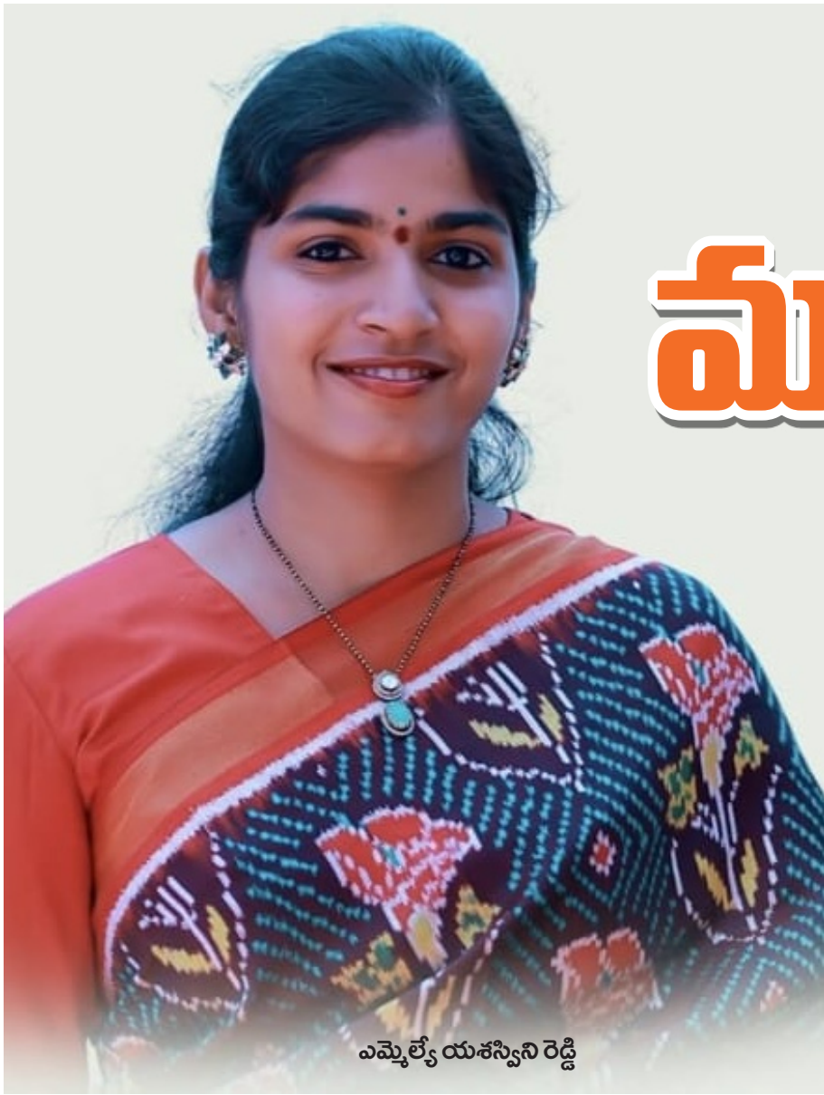
ఎమ్మెల్యే శశిని రెడ్డి