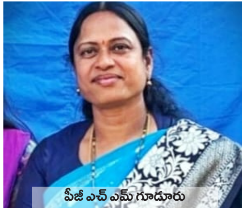
పీజీ ఎచ్ ఎమ్ గూడూరు