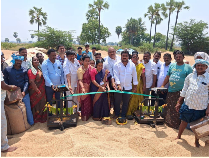
వేములపల్లి, ఏప్రిల్ 8(క్విక్ టుడే)