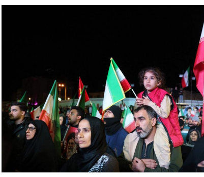
కాల్పుల విరమణతో ప్రపంచ శాంతి ఇరాన్ తో కాల్పుల విరమణపై అమెరికా డిల్ కుదుర్చుకున్న విషయం తెలిసింది. ఈ నేపథ్యంలో ట్రంప్ తన ట్రుత్ సోఫాలో ప్రకటన చేశారు. ప్రపంచ శాంతికి ఇది గొప్ప దినం అన్నారు. ఇరాన్ ఇదే కోరుకుంటోందన్నారు. తాజా