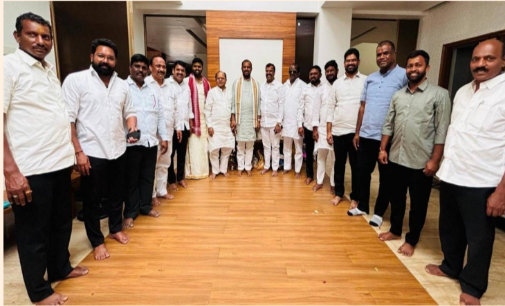
బోడుప్పల్, ఏప్రిల్ 8 (క్విక్ టుడే స్టూఫ్):