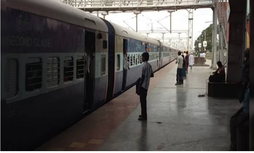
నేందుకు పోలీసులు యత్నించగా.. సుమారు 30 మంది గుంపు పోలీసులనే రౌండ్స్ చేసి దాడికి యత్నించారు. పరిస్థితి ఉద్రిక్తంగా మారడంతో పోలీసులు అదనపు బలంగా సాయం కోరారు. దీంతో దుండగులు అక్కడి నుంచి పరారయ్యారు. ఈ క్రమంలో వారిని కిలోమీటర్ల మేర చేజ్ చేశారు. కానీ నందిగ్రామ మండలంలోని పాత జాతీయ రహదారి పక్కనే ఉన్న ఎన్.సి.ఎల్ వెంచర్ గుండా పరుగులు తీసి చీకట్లో తప్పించుకున్నారు. కానీ ఇద్దరు మహిళలు మాత్రం పోలీసులకు చిక్కారు. వారిని బిహార్,

గన్నీ పోలీసులు రావడంతో మూలా పరార్ మూలాలో పోలీసులకు చిక్కిన ఇద్దరు మహిళలు హైదరాబాద్, ఏప్రిల్ 8 (క్విక్ టుడే న్యూస్): ఒడిశా, బిహార్ రాష్ట్రాల తరహాలో తెలంగాణలోనూ రైలుపై దాడి జరగడం కలకలం రేపింది. తిమ్మాపూర్ రైల్వే స్టేషన్ సమీపంలో వెంకటాద్రి ఎక్స్ ప్రెస్ లక్ష్యంగా దుండగులు రాజ్ తో దాడికి తెగబడ్డారు. గన్నీలో ఉన్న పోలీసులు అప్రమత్తమవ్వడంతో దుండగులు పారిపోయారు. ఈ క్రమంలో వారిని పట్టుకునేందుకు సినిఫస్కీలో పోలీసులు చేజింగ్ చేశారు. కానీ 30 మంది గ్యాంగ్ తప్పించుకుని వెళ్లింది. అయితే గ్యాంగ్ లోని ఇద్దరు మహిళలు మాత్రం పట్టుబడ్డారు. సికింద్రాబాద్ నుంచి తిరుపతి బయల్దేరిన వెంకటాద్రి ఎక్స్ ప్రెస్ గతరాత్రి తిమ్మాపూర్ పోలీస్ స్టేషన్ దాటుతున్న సమయంలో ట్రాక్ పక్కన 30 మంది గ్యాంగ్ మాటు వేసి ఒక్కసారిగా రాజ్ వరం కురిపించింది. కిటికీలు, బోగీలకు రాళ్లు తగలడంతో ప్రయాణికులు భయాందోళనలకు గురయ్యారు. సరిగ్గా అదే సమయంలో గన్నీ నిర్వహిస్తున్న పోలీసులు ఆ గుంపును గమనించి అడ్డుకునే ప్రయత్నం చేశారు. గ్యాంగ్ ను పట్టుకునేందుకు పోలీసులు యత్నించగా.. సుమారు 30 మంది గుంపు పోలీసులనే రౌండ్స్ చేసి దాడికి యత్నించారు. పరిస్థితి ఉద్రిక్తంగా మారడంతో పోలీసులు అదనపు బలంగా సాయం కోరారు. దీంతో దుండగులు అక్కడి నుంచి పరారయ్యారు. ఈ క్రమంలో వారిని కిలోమీటర్ల మేర చేజ్ చేశారు. కానీ నందిగ్రామ మండలంలోని పాత జాతీయ రహదారి పక్కనే ఉన్న ఎన్.సి.ఎల్ వెంచర్ గుండా పరుగులు తీసి చీకట్లో తప్పించుకున్నారు. కానీ ఇద్దరు మహిళలు మాత్రం పోలీసులకు చిక్కారు. వారిని బిహార్,