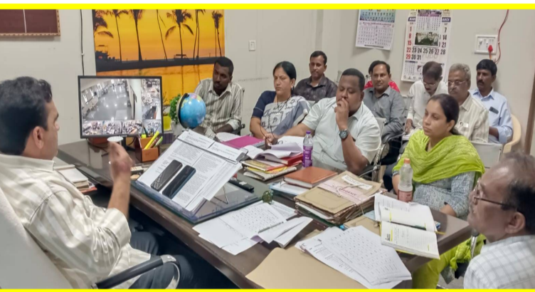
మహబూబాబాద్ ఏప్రిల్ 8