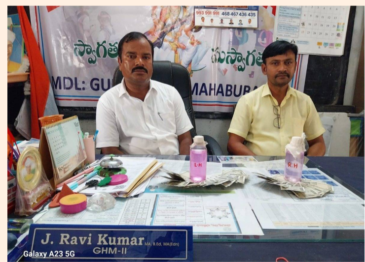
మహబూబాబాద్ నగర్, ఏప్రిల్ 8 (క్విక్ టుడే స్టూఫ్):