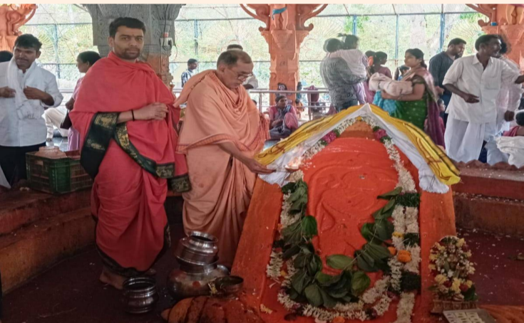
శివ్రంపేట, ఏప్రిల్ 18 (క్విక్ టుడే స్పెషల్):