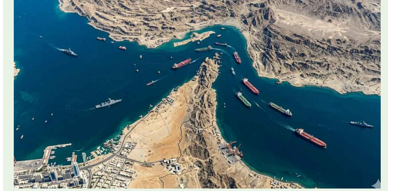
ట్రంప్, ఏప్రిల్ 18:

పశ్చిమాసియాలో ఉద్రిక్తతలు మరింత పెరిగాయి. నౌకా దిగ్బంధనం కొనసాగుతుందని ట్రంప్ ప్రకటించిన నేపథ్యంలో ఇరాన్ మళ్ళీ హోర్నుజ్ జలసంధిని మూసేసింది. తాజాగా హోర్నుజ్లో ప్రయాణిస్తున్న వాణిజ్య నౌకలపై కాల్పులు జరిగినట్లు మార్చుల వస్తున్నాయి. రెండు వాణిజ్య నౌకలపై ఇరాన్ సైన్యం కాల్పులకు పాల్పడినట్లు అంతర్జాతీయ మీడియా పేర్కొంది. వాటిలో భారత జెండా ఉన్న ట్యాంకర్ ఒకటి ఉన్నట్లు సమాచారం. హోర్నుజ్ జలసంధి గుండా వెళ్తున్న రెండు వాణిజ్య నౌకలపై ఐఆర్జీసీకి చెందిన ఇరాన్ గెన్ ఫోర్స్ కాల్పులు జరిపాయి. అయితే ఈ దాడిలో ట్యాంకర్లు, వాటిలోని సిద్ధాది సురక్షితంగానే ఉన్నారని సమాచారం. ఈ నేపథ్యంలో భారత్ కు చెందిన మరో రెండు నౌకలను దారి మళ్లించినట్లు 'ట్యాంకర్ ట్రాకర్స్' తెలిపింది. ఇరాక్ నుంచి రెండు మిలియన్ బ్యారెళ్ల ముడి చమురును భారత్ కు తీసుకొస్తున్న ట్యాంకర్లు హోర్నుజ్ జలసంధి నుంచి వెనక్కి మళ్లినట్లు సమాచారం. కాగా, అమెరికాతో చర్చల సందర్భంగా హోర్నుజ్ జలసంధిని హార్టిగా తెరుస్తున్నట్లు శుభవారం ఇరాన్ ప్రకటించింది. అయితే ఇరాన్ ఓడ రేవుల చుట్టూ అమెరికా దిగ్బంధనాన్ని కొనసాగిస్తున్నట్లు ట్రంప్ ప్రకటించారు. దీంతో ఇరాన్ తిరిగి హోర్నుజ్ జలసంధిని మూసేసింది. హోర్నుజ్ జలసంధిని మూసేసినట్లు ఇరాన్ ప్రకటించిన కొద్ది గంటల్లోనే ఈ కాల్పులు జరిగాయి.