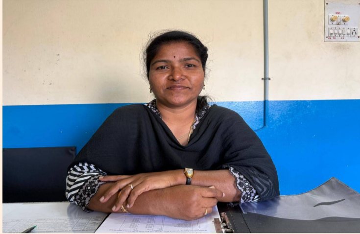
చర్లపల్లి, ఏప్రిల్ 18 (క్విక్ టుడే స్పెషల్):