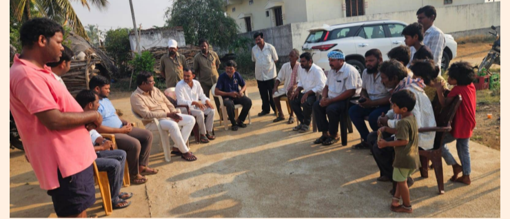
శివ్వంపేట, ఏప్రిల్ 17 (క్విక్ టు డే న్యూస్):