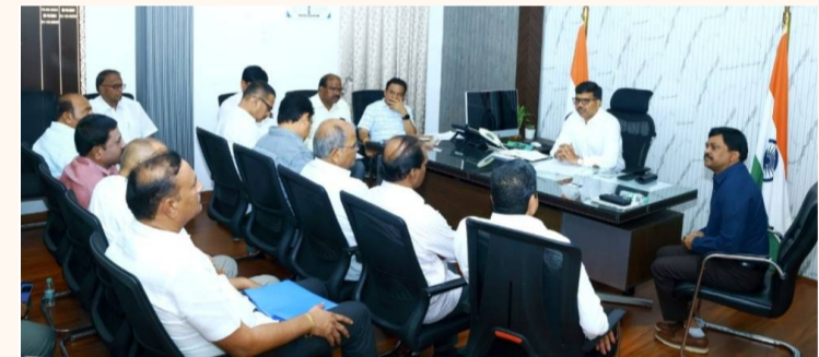
నల్గొండ ఏప్రిల్ 17 (క్విక్ టుడే న్యూస్):