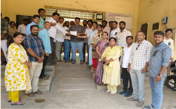
శివ్వంపేట, ఏప్రిల్ 17 (క్విక్ టు డే న్యూస్):

ఉద్యోగ, ఉపాధ్యాయ, పెన్షన్ల దీర్ఘకాలిక సమస్యలను పరిష్కరించాలని డిమాండ్ చేస్తూ మండల తహశీల్దార్ కార్యాలయం వద్ద జేపీసీ ఆధ్వర్యంలో నిరసన చేపట్టారు. రాష్ట్రవ్యాప్త పిలుపులో భాగంగా భోజన విరామ సమయంలో నల్ల బ్యాడ్జీలు ధరించి ఉద్యోగులు నిరసన వ్యక్తం చేశారు. అనంతరం తమ డిమాండ్లతో కూడిన వినతి పత్రాన్ని తహశీల్దార్ కు అందజేశారు. ప్రభుత్వం తక్షణమే స్పందించి సమస్యలను పరిష్కరించాలని వారు కోరారు.