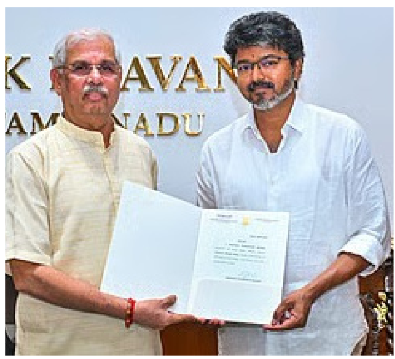
విజయ్ ను సీఎంగా నియమిస్తూ లేఖలను అందించారు. దాదాపు గంటా సలభై నిమిషాలు వీరి బేటీ జరిగింది. అనంతర్ ఎన్నికల ఫలితాల తర్వాత కీలక మలుపులు మిగతా 2లో