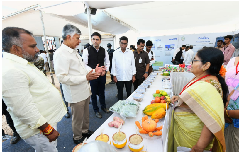
చిత్తూరు, మే24(క్విక్ టుడే న్యూస్):

ప్రతి ఒక్కరూ ఆరోగ్యాన్ని కాపాడుకోవాలి ఆరోగ్యమే మనకు అసలు సినలైన సంపద యోగా, ధ్యానం, ప్రాణాయామం జీవితంలో భాగం కావాలి ఆగస్టు 15 నాటికి రాష్ట్రమంతటా సంజీవని కండ్లెగలో నిర్వహించిన 'సంజీవని' కార్యక్రమంలో చంద్రబాబు