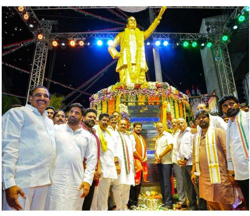
హైదరాబాద్, మే28(క్విక్ టుడే న్యూస్): ఎన్టీఆర్ కూడా అదే స్థాయిలో సమర్థవంతమైన నాయకత్వాన్ని తయారు చేశారని మిగతా 2లో

ఎన్టీఆర్ విగ్రహం ఏర్పాటు రాష్ట్ర అత్యగౌరవ ప్రతీక కేసీఆర్ కు రాజకీయ భిక్ష పెట్టింది ఎన్టీఆర్! విగ్రహం ఏర్పాటులో విమర్శలకు తావులేదు ఎన్టీఆర్ స్ఫూర్తితోనే ఇందిరమ్మ ఇళ్లు, మహిళలకు చీరలు పంపిణీ ముఖ్యమంత్రి రేవంత్ రెడ్డి కీలక వ్యాఖ్యలు అమీర్పేటలో ఎన్టీఆర్ విగ్రహం ఆవిష్కరణ