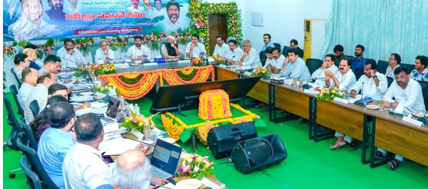
పరిషత్ లోని కొడంగల్ ఎత్తిపోతల పథకం పనుల పురోగతిని ప్రత్యేకంగా పరిశీలించారు. ఈ పథకంలో అత్యంత కీలకమైన కాటేవుపల్లి పంచ్ ఛాన్స్ వద్ద జరుగుతున్న పనుల నిర్మాణ శైలిని, పురోగతిని సీఎం రేవంత్ రెడ్డి స్వయంగా వీక్షించారు. ఈ ప్రాంతానికి సాగునీరు అందించడంలో ఈ ప్రాజెక్టు ఎంతో కీలకం కానుండటంతో దీనిపై ప్రభుత్వం ప్రత్యేక శ్రద్ధ వహిస్తోంది. ఏరియల్ సర్వే అనంతరం ముఖ్యమంత్రి రేవంత్ రెడ్డి నీటిపారుదల శాఖ అధికారులతో మాట్లాడారు. పాలమూరు జిల్లాలో పెండింగ్ లో ఉన్న సాగునీటి ప్రాజెక్టుల పనులన్నింటినీ యుద్ధప్రతిపాదికన వేగవంతం చేయాలని ఆదేశించారు. ఎలాంటి జాప్యం లేకుండా, నిర్దేశిత గడువులోగా పనులు పూర్తి చేసి రైతులకు సాగునీరు అందించేలా చర్యలు తీసుకోవాలని స్పష్టం చేశారు. మంత్రుల బృందం కూడా ప్రాజెక్టుల మార్గం ఉన్న అడ్డంకులను తొలగించి, పనులను త్వరగా ముగించాలని అధికారులకు సూచించింది. కార్యక్రమంలో రాష్ట్ర నీటి పారుదల శాఖ మంత్రి ఉత్తమ్ కుమార్ రెడ్డి,