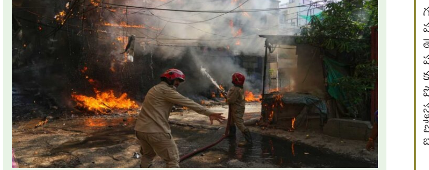
పరిసరాల్లో భారీగా పొగలు కమ్ముకోవడంతో ప్రధాన రహదారిపై వాహనాల రాకపోకలకు తీవ్ర అంతరాయం ఏర్పడింది. కిలోమీటర్ల మేర ట్రాఫిక్ జామ్ అయ్యింది. ట్రాఫిక్ పోలీసులు వాహనాలను ఇతర మార్గాల్లోకి మళ్లించి పరిస్థితిని చక్కదిద్దారు. ఘటన స్థలిలో దట్టంగా పొగలు అలుముకోవడంతో 15 నిమిషాల పాటు మెట్లో సేవలను సైతం నిలిపి వేశారు. ప్రమాద తీవ్రతకు వస్త్ర దుకాణం సహా హెల్మెట్ల దుకాణం కాళి బాడిదయ్యాయి. సుమారు 2 కోట్ల మేర ఆస్తి నష్టం జరగినట్లు సమాచారం.