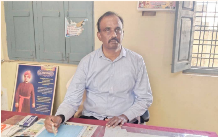
మేడిపల్లి, జూన్ 6 (క్విక్ టుడే స్పెషల్):