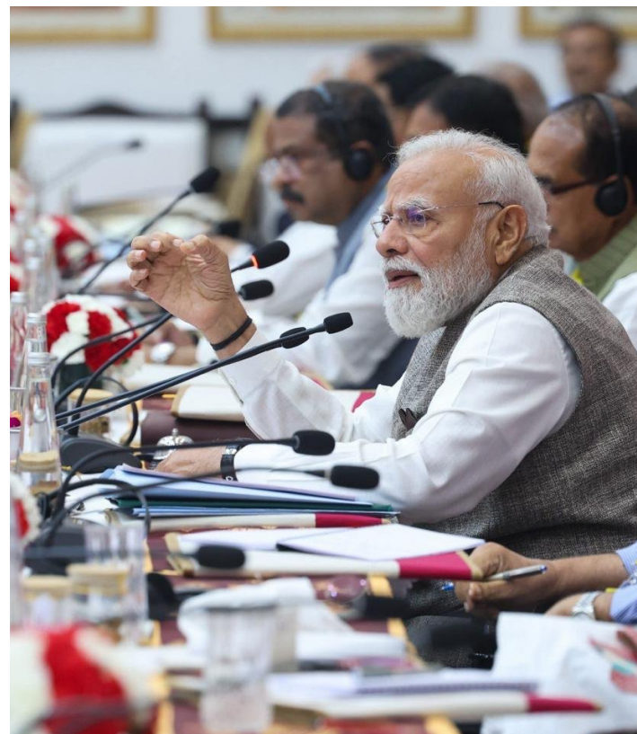
తులకు కొత్త అవకాశాలను సృష్టించేందుకు వీలుగా భారత్ అనేక దేశాలలో స్వేచ్ఛా వాణిజ్య ఒప్పందాలపై సంతకం చేసిందిని ప్రధాని గుర్తుచేశారు. ఈ ఒప్పందాలు దేశంలోని

ప్రపంచవ్యాప్తంగా అనిశ్చితి, అస్థిరత వికసిత భారత్ లక్ష్మీ సాధనకు యువత కీలకం రాష్ట్రాల సమష్టి బాధ్యత మరింత అవసరం భవిష్యత్తులో ఎంఎస్ఎంఈలకు మంచి అవకాశాలు నీతి ఆయోగ్ పాలకమండలి సమావేశంలో ప్రధాని మోదీ