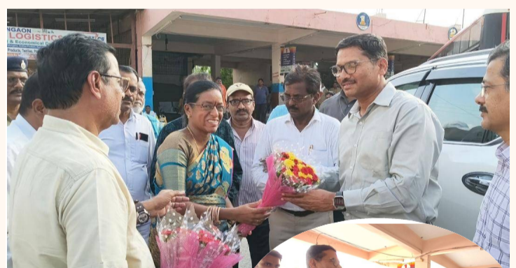
జనగామ, జూన్ 11 (క్విక్ టుడే స్పాస్):