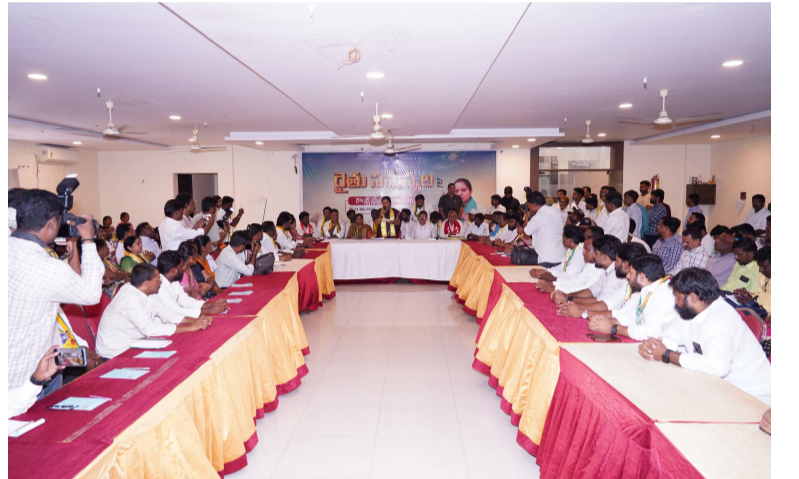
సౌకర్యాలన్నీ వ్యవసాయ రంగానికి ఇవ్వాలన్నారు. ఒక పరిశ్రమ ఏర్పాటు చేసేందుకు ప్రభుత్వాలను ఎన్ని సౌకర్యాలు కల్పిస్తారో వ్యవసాయ రంగానికి కూడా అన్ని సౌకర్యాలు సిద్ధం చేసి ఉంచాలని చెప్పారు. నాలుగు పైను బిచ్చం వేసినట్లు చేసి ఏదో దయ చూపుతున్నట్లు చేస్తే మార్పు రాదని అన్నారు. పసిబిడ్డను కాపాడినట్లు వ్యవసాయ రంగాన్ని కాపాడుకోవాల్సిన అవసరం ఉందని చెప్పారు. అందుకు కావాల్సిన సమగ్ర

రౌండ్ టేబుల్ సమావేశంలో పది తీర్మానాలను ఆమోదించినట్లు కవిత చెప్పారు. వాటిని పదివి వినిపించారు. 1. రైతు డిస్కం వద్దు, 2 యూరియ యాస్ తీసేయాలి, 3 బకాయి వద్ద రైతు భరోసా తక్షణమే ఇవ్వాలి. 4 కౌలు రైతులను గుర్తించి వారికి రైతు భరోసా ఇవ్వాలి. 5 రైతు కూలీలకు రూ. 12 వేలు ఇవ్వాలి. 6. నకిలీ విత్తనాలు, నకిలీ పురుగుల మందు అమ్మేవారిపై కఠిన చర్యలు తీసుకోవాలి. 7. మూసీ కాలుష్యాన్ని నివారించాలి. 8 నిమ్మ, బత్తాయి రైతులకు అండగా ఉండాలి. 9 వత్తి రైతుల సమస్యలను పట్టించుకోవాలి. 10 రైతు సమస్యలపై ఉమ్మడి