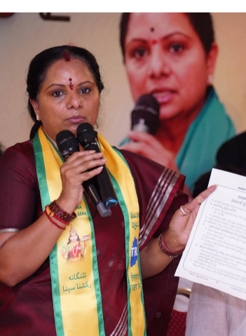
పట్టణాన్ని సమీక్షించే వచ్చిన అధికారంలోకి వచ్చిన కాంగ్రెస్... ఇప్పుడు అసెస్ట్ భూములను పరిశ్రమ పేరుతో లాక్కుంటుందని మండిపడ్డారు. జిల్లాకు చెందిన మంత్రి ఒకరు వందల ఎకరాల అసెస్ట్ భూములను కొని పెట్టుకుంటున్నారని... ఎన్నికల చివరి ఏడాది అసెస్ట్ భూములకు ప్రభుత్వం రైల్వే ఇస్తుందని ఆయన ఇదంతా చేస్తున్నారని చెప్పారు. అసెస్ట్ భూములను కాపాడుకోవాల్సిన అవసరమందని... అందుకు ప్రజలంతా పోరాటానికి సిద్ధం కావాలని కవిత పిలుపునిచ్చారు.

రేవంట్ రెడ్డి సర్కార్ లో రైతులు విలవిలలాడుతున్నారని కవిత అన్నారు. రైతు రుణమాఫీ కాక, రైతు భరోసా కాక, యూరియ లేక, ధాన్యం కొనుగోళ్లు లేక, సాగు నీళ్లు లేక అవస్థలు పడుతున్నారని ఆమె ఆవేదన వ్యక్తం చేశారు. 75 లక్షల మెట్రిక్ టన్నుల ధాన్యాన్ని కొనుగోలు చేసి రైతులకు మేలు చేయాలి ఉండగా సిగ్గు లేకుండా ఉల్టా వారి నుంచే కప్పం కట్టించుకుంటున్నారని అన్నారు. క్విట్టాల్ కు 6 కోట్ల తరుగు తీస్తూ, రవాణా ఛార్జీలు రైతులపైనే వేస్తూ దాదాపు 12