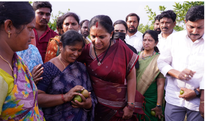
నల్గొండ, జూన్ 11 (క్విక్ టుడే స్పాస్):

రైతు డిస్కం పేరుతో ఉచిత విద్యుత్ ఎత్తివేసి కుట్ర అధికారంలోకి వచ్చిన నాటి నుంచి వ్యవసాయశాఖ పై సీఎం లివ్వు లేదు మట్టి తల్లిని అలుసుగా చూస్తూ వ్యవసాయాన్ని కర్కకు వదిలేస్తున్నారు ప్రభుత్వాలకు ఉక్కు సంకల్పం ఉంటే వ్యవసాయ రంగంలో అడ్డుతాలు చేయవచ్చు వ్యవసాయాన్ని ఒక పరిశ్రమగా గుర్తించి పారిశ్రామిక వేత్తలకు ఇస్తున్న సౌకర్యాలు రైతులకు ఇవ్వాలి రైతును రాజు చేసేందుకు తెలంగాణ రక్షణ సేన ప్రత్యేక కార్యచరణ చేపడుతుంది