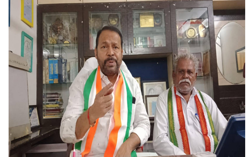
పరిమితమైందని, సామాన్య ప్రజల సమస్యలను పరిష్కరించడంలో విఫలమైందని విమర్శించారు. నిత్యపనర వస్తువుల ధరల పెరుగుదల, నిరుద్యోగం, రైతుల సమస్యలు, మహిళా భారలపై ఆర్థిక భారాలపై కేంద్ర ప్రభుత్వం సమాధానం చెప్పాలని డిమాండ్ చేశారు.ప్రజలకు నిజమైన అభివృద్ధి మూల్యం చెల్లించడంలో కేంద్ర ప్రభుత్వం విఫలమైందని, ప్రచారం కంటే ప్రజా సమస్యల పరిష్కారంపైనే దృష్టి సారించాలని కేంద్ర ప్రభుత్వాన్ని డిమాండ్ చేశారు.

రాజకీయ ప్రాతినిధ్యం విషయంలో కేంద్ర ప్రభుత్వం చిత్తశుద్ధితో వ్యవహరించడం లేదని విమర్శించారు.మహిళల సాధికారత కోసం పనిచేస్తున్నామని చెప్పే బీజేపీ ప్రభుత్వం, మహిళా నాయకులకు న్యాయం చేయడంలో పూర్తిగా విఫలమైందని ఆరోపించారు. ప్రజాస్వామ్య వ్యవస్థపై అనుమానాలు కలిగించే విధంగా వ్యవహరించడం దేశానికి మంచిది కాదని అన్నారు.గత 12 సంవత్సరాలుగా కేంద్రంలో అధికారంలో ఉన్న మోడీ ప్రభుత్వం ప్రచార ఆర్జుటాలకే