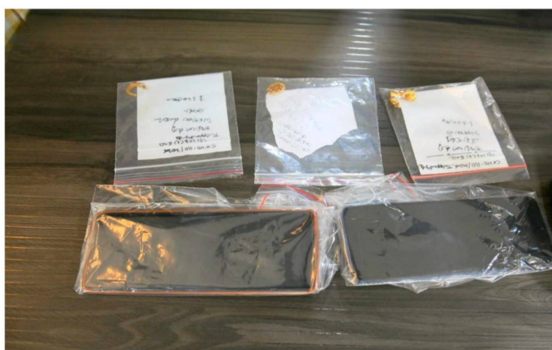
నల్గొండ జూన్ 12 (క్విక్ టుడే న్యూస్)

-మద్యం పార్టీ ఆపై నమ్మకద్రోహం , -30 వేల అప్పు వివాదమే ఘోరానికి కారణము