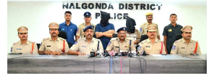
మద్యం తాగి...రాయితో కొట్టి..