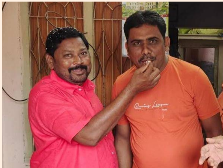
మార్కాపురం జిల్లా డ్యారో, జూన్ 12,