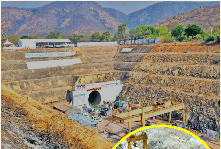
యర్రగొండపాలెం జూన్ 12,

వెలిగొండ ప్రాజెక్టు నిర్వాసితులకు రాష్ట్ర ప్రభుత్వం మరోసారి శుభవార్త అందించింది. నిర్వాసిత కుటుంబాలకు పరిహారం చెల్లింపులు, పునరావాస కార్యక్రమాలను మరింత వేగవంతం చేసేందుకు 2026-27 ఆర్థిక సంవత్సర బడ్జెట్లో అదనంగా రూ.906 కోట్లను కేటాయిస్తూ ప్రభుత్వం ఉత్తర్వులు జారీ చేసింది. వెలిగొండ ప్రాజెక్టు నిర్వాసితుల కారణంగా ప్రభావితమైన కుటుంబాల పునరావాసానికి ప్రభుత్వం ప్రత్యేక ప్రాధాన్యత ఇస్తోంది. గతంలో గుర్తించిన 7,321 నిర్వాసిత కుటుంబాల్లో ఇప్పటికే 7,225 కుటుంబాలకు పునరావాస ప్రాజెక్టులు అందజేసినట్లు అధికారులు వెల్లడించారు. మిగిలిన కుటుంబాలకు కూడా త్వరితగతిన పరిహారం అందించి పునరావాస ప్రక్రియను పూర్తి చేయనున్నట్లు తెలిపారు. అదనంగా విడుదల చేసిన నిధులను పునరావాస కాలనీలలో రహదారులు, తాగునీటి సౌకర్యాలు, విద్యుత్, డ్రైనేజీ వ్యవస్థ, పాఠశాలలు, ఆరోగ్య కేంద్రాలు తదితర మౌలిక వసతుల అభివృద్ధికి వినియోగించనున్నారు. దీంతో నిర్వాసిత కుటుంబాలకు మెరుగైన జీవన పరిస్థితులు కల్పించేందుకు అవకాశం ఏర్పడనుంది. ప్రభుత్వ నిర్ణయంపై నిర్వాసితులు హర్షం వ్యక్తం చేస్తున్నారు. దశాబ్దాలుగా ఎదురుచూస్తున్న పునరావాస సమస్యలకు పరిష్కారం లభిస్తోందని, మిగిలిన కుటుంబాలకు కూడా న్యాయం జరుగుతుందనే ఆశాభావాన్ని వ్యక్తం చేశారు.