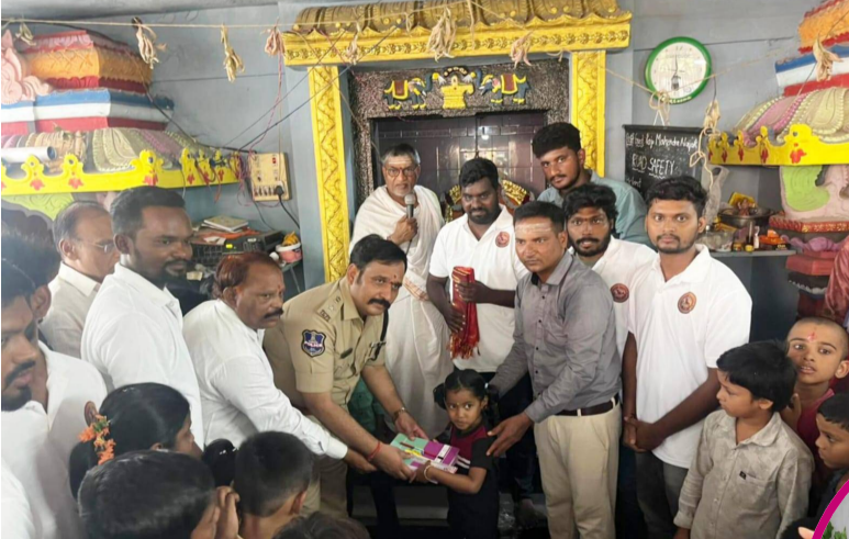
జనగామ, జూన్ 12 (క్విక్ టుడే స్పాస్) :

జనగామ పట్టణంలోని శ్రీ ఉమామహేశ్వర స్వామి దేవాలయంలో శివాజీ ఫౌండేషన్ ఆధ్వర్యంలో విద్యార్థులకు ఉచితంగా పుస్తకాలు, పెన్సిల్లు పంపిణీ కార్యక్రమం