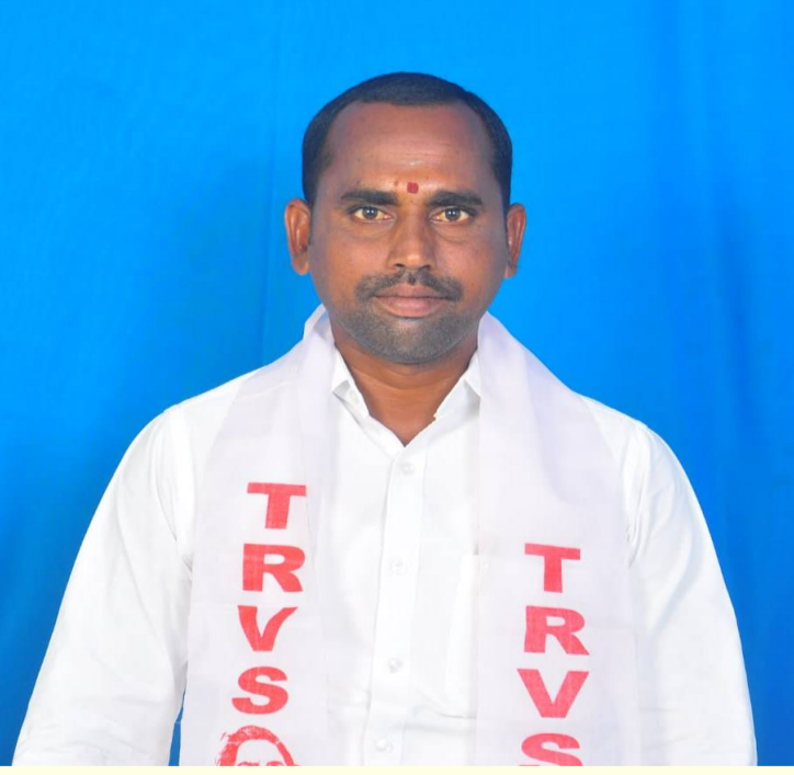
తొర్రూరు జూన్ 12(క్విక్ టుడే స్పాస్) :