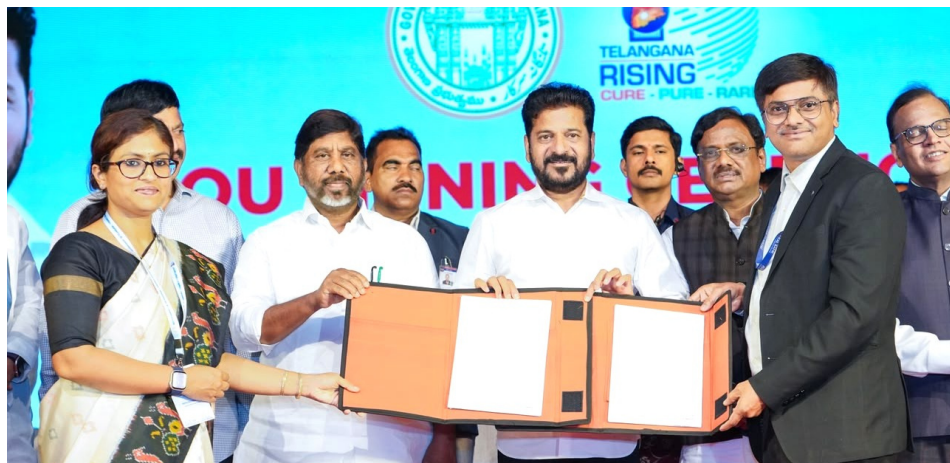
వరకు కవరేజీ లభిస్తుందని తెలిపారు. విమాన ప్రమాదాల సందర్భంలో బ్యాంకులు రూ.2 కోట్ల నుంచి రూ.3 కోట్ల వరకు బీమా రక్షణ అందిస్తాయని వివరించారు. రాష్ట్ర అభివృద్ధి కోసం కృషి చేస్తున్న ఉద్యోగులందరికీ సీఎం

హైదరాబాద్, జూన్ 25 (క్విక్ టుడే న్యూస్): రాష్ట్ర ప్రభుత్వ ఉద్యోగులు, పెన్షన్లకు, కాంట్రాక్ట్, ఔట్సోర్సింగ్, ఇతర తాత్కాలిక ఉద్యోగులకు కూడా ఉచిత ప్రమాద బీమా సదుపాయం కల్పించనున్నట్లు ముఖ్యమంత్రి రేవంత్ రెడ్డి ప్రకటించారు. ఈ మేరకు 14 బ్యాంకులతో ప్రభుత్వం అవగాహన ఒప్పందాలు కుదుర్చుకుంది. రవీంద్రభారతిలో జరిగిన కార్యక్రమంలో సీఎం స్వయంగా ఒప్పందాలపై సంతకాలు చేసి పథకాన్ని ప్రారంభించారు. ఈ సందర్భంగా సీఎం మాట్లాడుతూ.. ప్రభుత్వం కోసం కష్టపడే ఉద్యోగుల భద్రతను కాపాడటం తమ బాధ్యత అని చెప్పారు. ఉద్యోగులు అడగక ముందే ప్రభుత్వం ముందుకు వేసి ఈ నిర్ణయం తీసుకుందని పేర్కొన్నారు. పదవీ విరమణ తర్వాత కూడా బీమా ప్రయోజనాలు కొనసాగించేలా చర్యలు తీసుకున్నామని వెల్లడించారు. ప్రమాద బీమా కింద ఉద్యోగులకు రూ.1 కోటి నుంచి రూ.1.5 కోట్ల