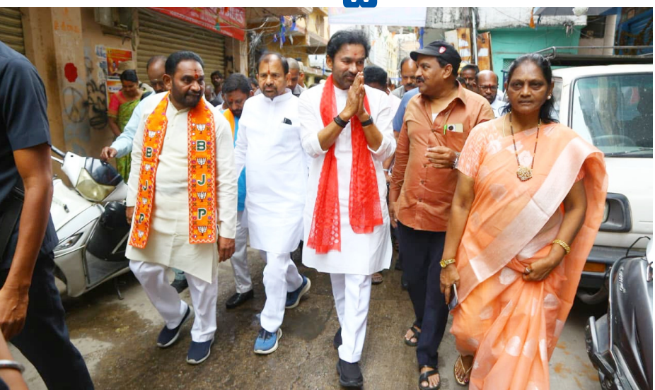
కోసం ఉపయోగించే ఒక పత్రం (ATనజీల. ఆనీజాబీపనిబి) మాత్రమేనని కేంద్ర మంత్రి తెలిపారు. ఆ చట్టంలోని సెక్షన్ 20 ప్రకారం.. ప్రజాహితం దృష్ట్యా భారత పౌరుడు కాని వ్యక్తి కూడా కేంద్ర ప్రభుత్వం పాస్ పోర్టు లేదా ట్రావెల్ దాక్యుమెంట్ ను జారీ చేసే ప్రత్యేక అధికారాన్ని కలిగి ఉంటుందని గుర్తుచేశారు. గతంలో కూడా ఇటువంటి ప్రత్యేక సందర్భాలు ఉన్నాయని, అందువల్ల పాస్ పోర్టును మాత్రమే పౌరసత్వానికి తుది ప్రాతిపదికగా పరిగణించలేమని చెప్పారు. ఇది ఇప్పటి కప్పుడు తెచ్చిన కొత్త నిబంధన కాదని, 1967లో కాంగ్రెస్ ప్రభుత్వ హయాంలోనే ఈ చట్టం అమల్లోకి వచ్చిందని తెలిపారు. దాదాపు 60 ఏళ్లుగా అమల్లో ఉన్న చట్టపరమైన అంశాన్ని ఇప్పుడు మోడి ప్రభుత్వంపై నెట్టడం అవగాహన లోపమో, లేదా వ్యాపాలను దావిపెట్టే కుట్రో అవుతుందని ఆగ్రహం వ్యక్తం చేశారు. పౌరసత్వ చట్టం 1955 ప్రకారం ఒక వ్యక్తి భారత పౌరసత్వం అనేది జననం, చంశపారంపర్యం, నమోదు లేదా నేచురలైజేషన్ పత్రాలు ద్వారా

ఎంపీ అసదుద్దీన్ ఒవైసీ భారత పాస్ పోర్టులు, పౌరసత్వంపై ఇటీవల చేసిన వ్యాఖ్యలు చట్టపరంగా తప్పుదారి పట్టించేవిగా ఉన్నాయని కేంద్ర మంత్రి జి. కిషన్ రెడ్డి తీవ్రస్థాయిలో ద్వజమెత్తారు. ఒక ప్రజా ప్రతినిధిగా, న్యాయవాదిగా ఉన్న అసదుద్దీన్ కు పాస్ పోర్టుకు, పౌరసత్వానికి మధ్య ఉన్న చట్టపరమైన తేడాలు తెలిసి ఉండాలని ఆయన తీవ్రపై ఫలీకారు. రాజ్యాంగ బద్ధమైన పదవుల్లో ఉన్నవారు బాధ్యతాయుతంగా మాట్లాడాలని పేర్కొన్న కిషన్ రెడ్డి.. ప్రజలను తప్పుదారి పట్టించే ముందు అసదుద్దీన్ ఒవైసీ పౌరసత్వ చట్టం 1955, పాస్ పోర్ట్ చట్టం 1967లను మరోసారి క్లుణ్ణంగా అధ్యయనం చేయాలని సూచించారు. అసదుద్దీన్ వ్యాఖ్యలు చట్టంపై ఆయనకున్న అవగాహన లోపాన్ని, రాజకీయ ప్రయోజనాల కోసం ప్రజల్లో అయోమయం సృష్టించే ప్రయత్నాన్ని సూచిస్తున్నాయని మండిపడ్డారు. విదేశాంగ మంత్రిత్వ శాఖ ఇచ్చిన వివరణను కొందరు తప్పుగా చిత్రికరిస్తున్నారని కిషన్ రెడ్డి స్పష్టం చేశారు. విదేశాంగ శాఖ వివరణ ప్రకారం భారత పాస్ పోర్టు విలువలేనిదని అర్థం కాదని, పాస్ పోర్టు ఒక్కటి భారత పౌరసత్వానికి తుది, ఖచ్చితమైన ఆధారం కాదని మాత్రమే ప్రభుత్వం పేర్కొందని ఆయన వివరించారు. భారత పౌరసత్వం అనేది ఎల్లప్పుడూ భారత రాజ్యాంగం, పౌరసత్వ చట్టం 1955 ప్రకారమే నిర్ణయించబడుతుందని స్పష్టం చేశారు. పాస్ పోర్ట్ చట్టం 1967 ప్రకారం పాస్ పోర్టు అనేది ప్రధానంగా విదేశీ ప్రయాణాల