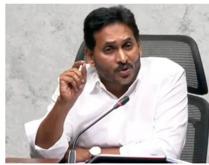
కల్పించడానికా? లేక అధికార పార్టీ అరాచకాలకు కాపలా కాయడానికా? అని ప్రశ్నించారు. ఒకటి రెండు చోట్ల పోలీస్ అధికారులే దగ్గరుండి ఈ దాడులను కో ఆర్డినేట్ చేయడం అత్యంత దారుణమని ఆవేదన వ్యక్తం చేశారు. భూములు ఇప్పుడు ప్రైవేటీకరణ నోటీసులతో వేధించడం, వారి పొలాలకు వెళ్లే దారులను ద్వంసం చేయడం, అక్రమంగా మట్టి తవ్వి దోపిడీ చేయడం లాంటి దారుణాలు అమరావతిలో సాగుతున్నాయని జగన్ పేర్కొన్నారు. కొండవీటి వాగు నీటిని బలవంతంగా రైతుల భూముల్లోకి మళ్లించి, వారికి గత్యంతరం లేని పరిస్థితులు

రాజధాని ప్రాంతంలో వైసీపీ మాజీ మంత్రులు, ఎమ్మెల్యేలపై జరిగిన దాడి పుటనపై వైఎస్సార్ కాంగ్రెస్ పార్టీ అధినేత, మాజీ ముఖ్యమంత్రి వైఎస్ జగన్ మోహన్ రెడ్డి తీవ్రస్థాయిలో మండిపడ్డారు. ఈ మేరకు ఆయన సామాజిక మాధ్యమం 'ఎక్స్ వేదిక' గా సీఎం చంద్రబాబు నాయుడుపై నిప్పులు చెరిగారు. చంద్రబాబు గారు.. పేరు ప్రభుత్వాన్ని నడుపుతున్నారా? లేక గౌరండాలు రాజ్యం నడుపుతున్నారా? 'అంటూ ఘాటుగా ప్రశ్నించారు. రాజధాని ప్రాంత రైతుల ఆహ్వానం మేరకు సీఆర్ డి పరిరక్షణ కమిటీతో కలిసి వెళ్తున్న వైసీపీ నేతలపై పట్టపగలే దాడులు చేయడం ప్రజాస్వామ్యాన్ని ఖానీ చేయడమేనని ద్వజమెత్తారు. అమరావతి పేరుతో ప్రభుత్వం చేస్తున్న అవినీతి, దోపిడీ, రైతులపై సాగున్న దౌర్జన్యం ఎక్కడ బయటకు వస్తాయోననే భయంతోనే చంద్రబాబు స్వయంగా ఈ దాడులను ఉసిగొల్పారని వైఎస్ జగన్ ఆరోపించారు. ఈ క్రమంలో పోలీసుల తీరును కూడా ఆయన తప్పుపట్టారు. పోలీసులు ఉన్నది ప్రజలకు భద్రత