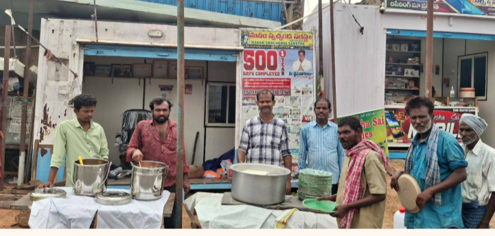
నార్కట్ పల్లి జూన్ 27(క్విక్ టుడే న్యూస్):