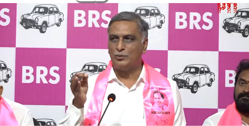
హరిద్ రావు హితవు పలికారు. కాంగ్రెస్ వైఖరి వల్ల ఆంధ్రప్రదేశ్ సుజలం, కర్ణాటక సుఫలం, తెలంగాణ నిష్ఫలంగా మారుతుందని, కృష్ణా, గోదావరి జలాల్లో తెలంగాణకు ఒక్క చుక్క నీటి విషయంలో అన్యాయం జరిగినా కేసీఆర్, బీఆర్ఎస్ ఊరుకునే ప్రసక్తే లేదని తస్యాత్ జాగ్రత్త అంటూ హెచ్చరించారు.

ఒప్పుకోదని స్పష్టం చేశారు. గత అరవై ఏళ్లలో కాంగ్రెస్ ఏడాదికి సగటున 4 టీఎంసీల చొప్పున అనుమతులు తెస్తే, బీఆర్ఎస్ హయాంలో ప్రతి ఏడాది 44 టీఎంసీల చొప్పున పర్యావస్తు తెచ్చామని గుర్తుచేశారు. మనకు రావాల్సిన 968 టీఎంసీలలో 830 టీఎంసీలకు అనుమతులు తెచ్చుకు న్నామని, ఇంకా 138 టీఎంసీల అనుమతులు రావాల్సి ఉందని వివరించారు. ఏపీ ప్రభుత్వం అక్రమంగా 'బన కచర్ల' ప్రాజెక్ట్ నిర్మిస్తుంటే కాంగ్రెస్ ప్రభుత్వం మొద్దు నిద్ర పోయిందని, ఆ నిద్రను తట్టిలేపింది బీఆర్ఎస్సెనిని చెప్పారు. పాలమరీరు పేరిట సమకృత సారక ప్రాజెక్టును రేపంత్ రెడ్డి ఎండబెడుతున్నారని, తాగేందుకు మంచి నీళ్లు లేక పాలమరీరు తీవ్రంగా నష్టపోతుందని ఆవేదన వ్యక్తం చేశారు. మన రాష్ట్రంలోని మేడిగడ్డ గోట్లను రివేర్ చెయ్యడం చేతకాదు గానీ, తుంగభద్ర గోట్ల రివేర్ కోసం రేపంత్ రెడ్డి వెళ్తున్నారని విమర్శించారు. హైదా విషయంలో రేపంత్ రెడ్డికి హిట్లర్ స్ఫూర్తి అయితే, నీళ్ల విషయంలో రోమ్ తగల బడుతుంటే ఫిడెల్ వాయిదా వినే నీరో చక్రవర్తి స్ఫూర్తి అనిపి స్తోందని ఎద్దేవా చేశారు. గుంపు మే | స్త్రీ అయిన రేపంత్ రెడ్డి, తెలంగాణను ముంచే ముంపు మే | స్త్రీ కావద్దని