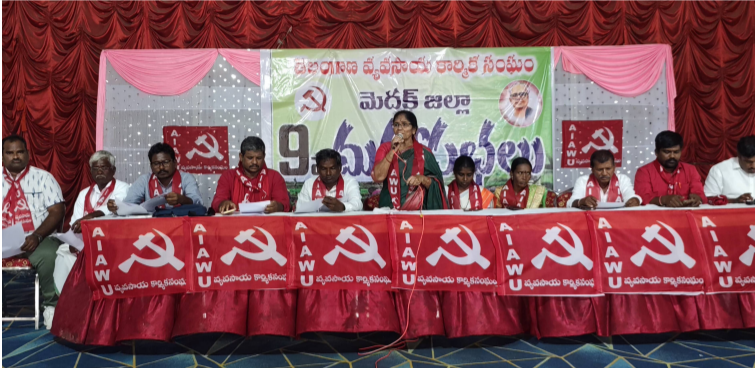
శివ్వంపేట, జూన్ 7 (క్విక్ టుడే న్యూస్):