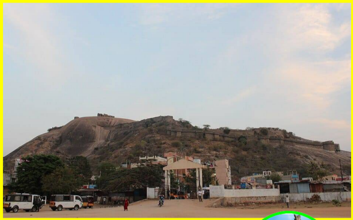
మహాబాబునగం జూన్ 7